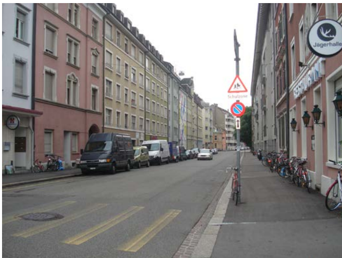
Abbildung 5: Knappe Platzverhältnisse im Umfeld der Siedlung Erlentor

Rund um die Siedlung gibt es circa 30 bis 40 öffentliche Veloabstellplätze, wo auch Velos angekettet werden können. Die Situation mit privaten Abstellplätzen ist luxuriös – siehe dazu nachfolgenden Abschnitt. Die Zugänglichkeit ist perfekt. Die Veloabstellsituation im Quartier dagegen ist ungenügend: wildes Parkieren, Diebstähle, Vandalismus etc.