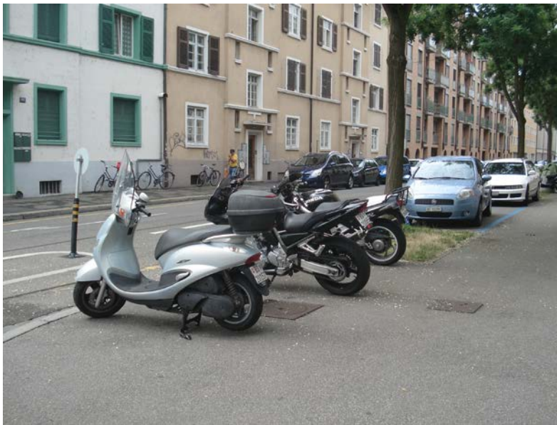
Abbildung 6: Wildes Parkieren in der Umgebung der Siedlung

Völlig entgegengesetzt sieht das Bild im Quartier aus. Hier sind flächendeckend falsch parkierte Autos und Motorräder in der blauen Zone auszumachen und das wilde Parkieren ist allgegenwärtig.