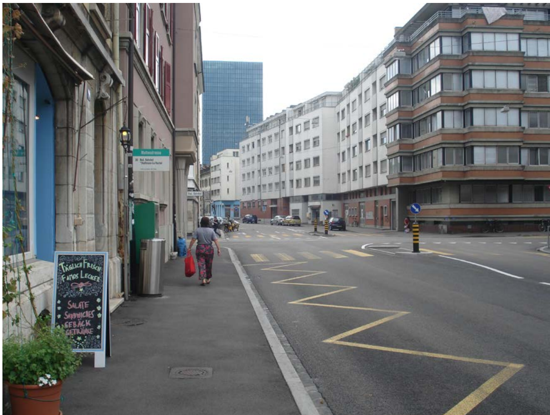
Abbildung 4: Situation bei der Haltestelle Mattenstrasse

Die nächsten Bushaltestellen (Mattenstrasse und Erlenmatt) befinden sich in circa 150 Meter Entfernung der Siedlungsgrenzen. Sie haben acht Abfahrten in Spitzenstunden. Die Haltestellen sind schlecht ausgestattet. Bei der Haltestelle Mattenstrasse fehlen Sitzgelegenheiten und Witterungsschutz, bei der Haltestelle Erlenmatt sind diese wenigstens auf der Seite der stadteinwärts verkehrenden Busse vorhanden.